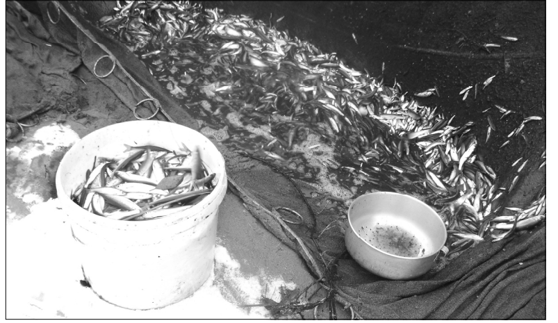
Ловля голяна традиционным методом.