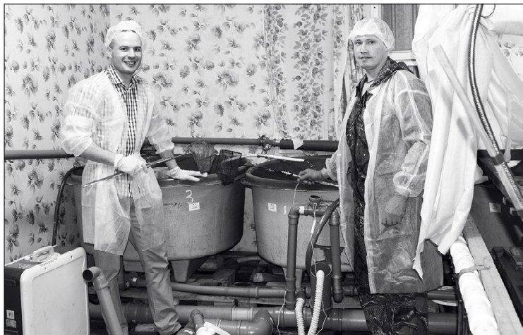
В инкубационном цехе.

■ Новыми обитателями Мезени стали 100 тысяч мальков хариуса