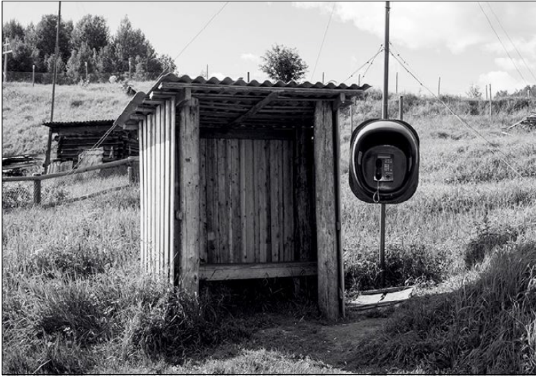
Битог таксофон оз уджав.