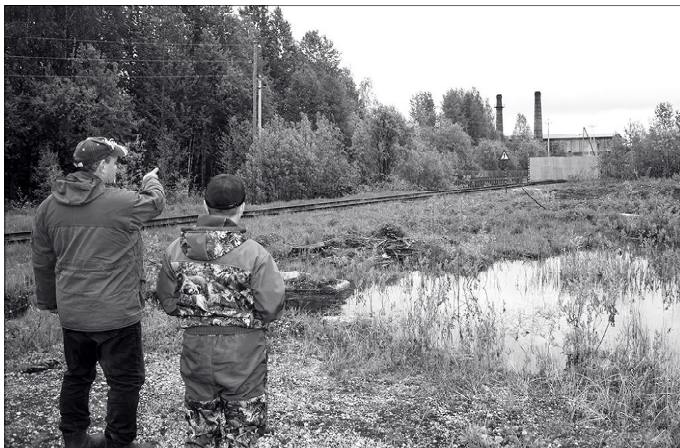
Природоохрана - в рейде.

Понятно, что в период распутицы вывозить отходы из Пыссы, Важгорта, Чупрово и Пучкомы затруднительно, поэтому утверждены схемы возведения пунктов временного хранения твердых коммунальных отходов. Это должны быть площадки с твердым покрытием, ограждением и навесом в границах населенного пункта, где отходы можно хранить до 11 месяцев. Администрацией района утверждены земельные участки под эти площадки, внесены в кадастр. Дело осталось за малым - возведением самих площадок. Пока же накопление отходов на необорудованных для этого территориях вызывает беспокойство, как у нас, так и населения. Поскольку существует угроза загрязнения окружающей среды. Кроме этого, несанкционированные свалки привлекают хищников, что