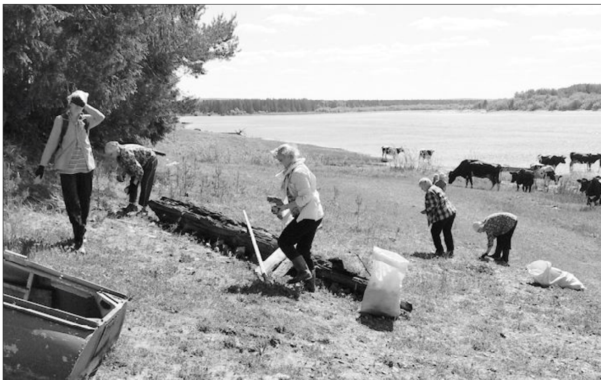
Чище стало на берегу. Село Чернутьево.

■ Жители Удоры принимают участие в акции «Речная лента»