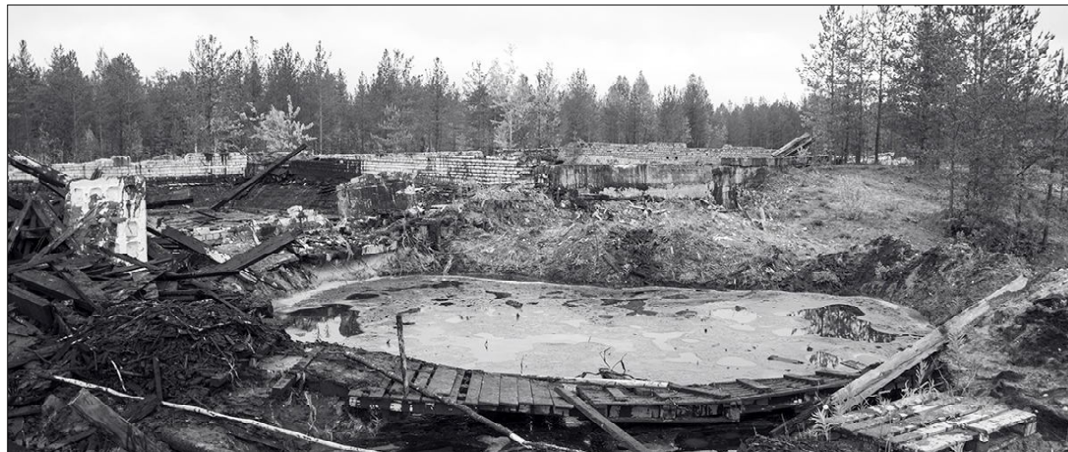
Мазутное «озеро» на месте бывшего АБЗ.