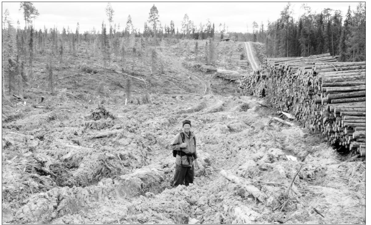
Вырубка леса по «новым» технологиям.