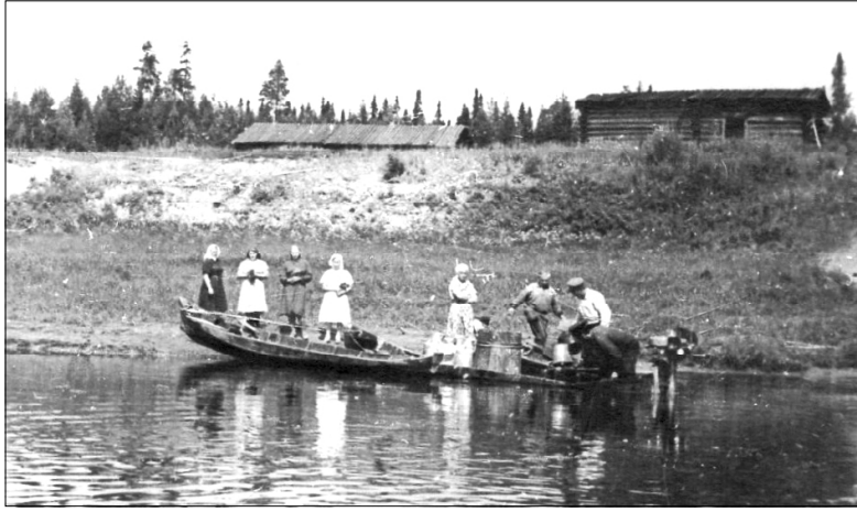
Ловля рыбы неводом.

Жизнь людей в одинаковых природных условиях похожа. Только отличается традициями, обычаями, оставленными нам предками. Река Мезень была основной дорогой, связывающей соседние деревни, а также кормила и поила жителей. Интересно, что ловля рыбы на удочку считалась пустым времяпрепровождением. Сейчас это отдых, а раньше не было времени прохлаждаться, надо было кормить семью, и традиционные способы ловли рыбы были артельными.