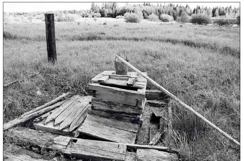
Струбьяс киссьоны, ва - абу.

Киссьома и Кутш ель вомон пос. Колө дзоньтавын. Зөв лөкөсь и ва струбьяс, ваис абу да унаон сийөс каталөны юыс