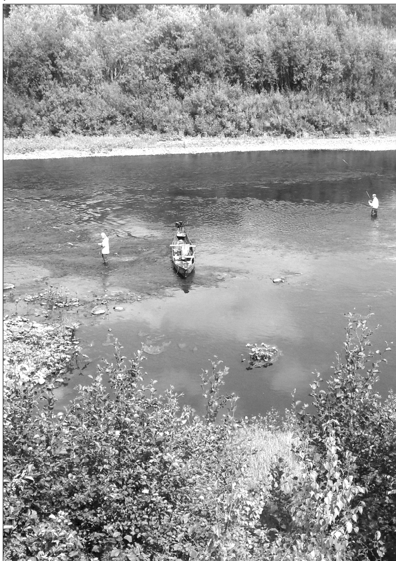
На малой речке.

«Не лжет природа. Мы ей лжем, Когда, торя пути кривые, Приходим в чащи вековые С машиной, с топором, С ножом. Приходим, чтобы убить ее И новой бойне научиться, Забыв, что наше бытие- Лишь бытия ее частица. «Потом вернем!» - клянемся мы, Но клятве той не верим сами. И под зарю блестят слезами Опустошенные холмы». Альберт ЛОГИНОВ.